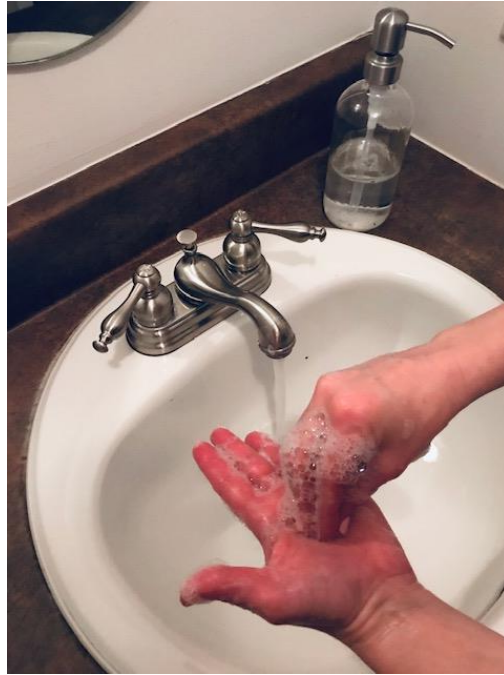
Nettoyer mes pouces